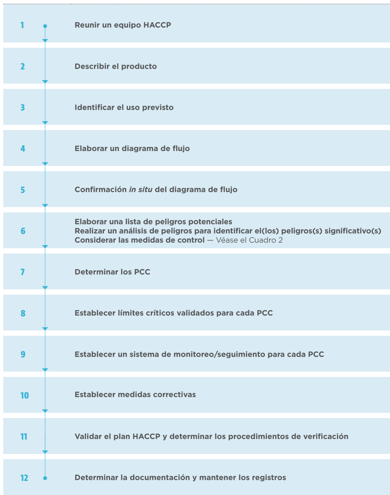
Figura 1 Secuencia lógica para la aplicación del HACCP